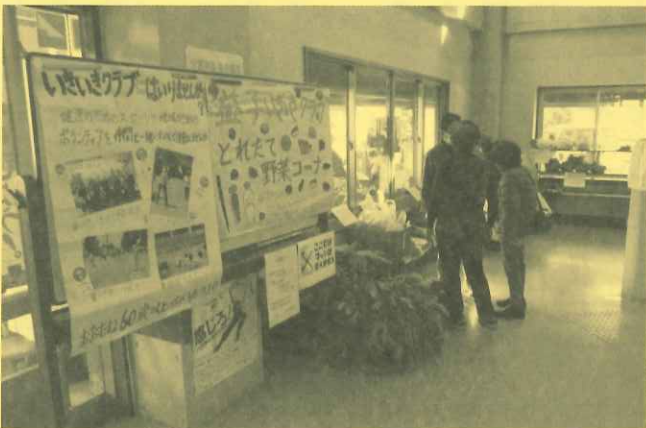
〈とれたて野菜コーナー〉